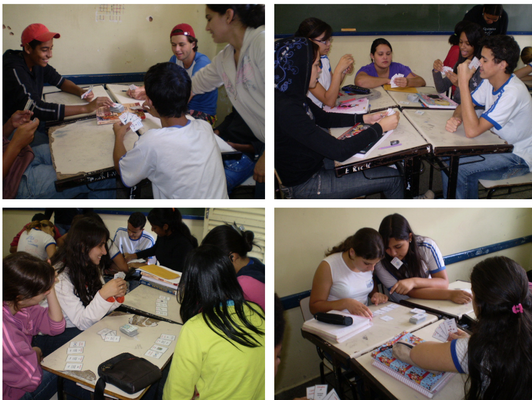
Figura 3: Fotos da aplicação do “Jogo das Ligações”.

Algumas fotos da aplicação do jogo são apresentadas na Figura 3.