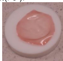
Figura 1. Fotografia do filme \text{CS}-[\text{Fe}(\text{CN})_5(\text{pz})]^{3-} sobre base de Teflon®.

O filme \text{CS}-[\text{Fe}(\text{CN})_5(\text{NH}_3)]^{3-} , após imersão em solução de pz, passou de amarelo para rosa (Figura 1) sendo consistente com a observação de uma banda no espectro UV-Vis do filme \text{CS}-[\text{Fe}(\text{CN})_5(\text{pz})]^{3-} em 525 nm atribuída a transição MLCT \pi\pi^*(\text{pz}) \leftarrow d\pi(\text{Fe}^{\text{II}}) .