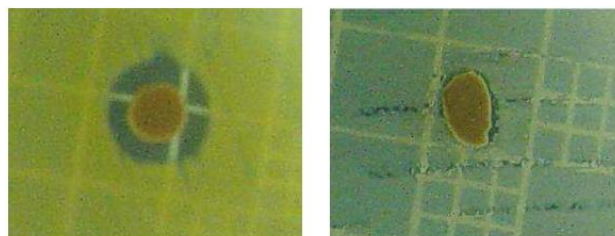
Figura 2. Teste microbiológico com borracha de silicone contendo o complexo trans - [RuCl 2 (vpy) 4 ] e impregnadas com AgNPs, usando os microorganismos S. aureus ATCC 6538 em (a) e E. coli ATCC 25922 em (b).

Os testes microbiológicos indicaram que somente as amostras que continham AgNPs apresentaram alguma propriedade antimicrobiana, conforme pode ser visto na Figura 2. Para o microorganismo S. aureus ATCC 6538 observou-se a presença de um halo de inibição de 11 mm, já para o microorganismo E. coli ATCC 25922 percebeu-se a ausência de crescimento bacteriano próximo a superfície da amostra.