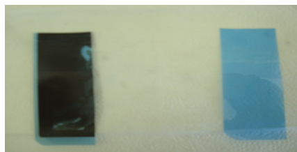
Figura 1 -placa radiográfica antes e após a remoção da prata.

Em relação a remoção/recuperação da prata presente nas radiografias a única solução que apresentou resultados positivos foi a solução de hipoclorito a 2%. Após 6 horas de contato as tiras de radiografia apresentaram uma remoção completa da prata depositada em sua superfície. Sendo que esta apresentou-se em solução na forma de um precipitado, o que facilitou sua recuperação por centrifugação.