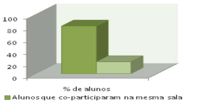
Figura 1. A contribuição do estágio de co-participação para minimizar as dificuldades em sala de aula.

Os resultados de porcentagem para as diversas alternativas dos discentes sobre o estágio de co-participação encontram-se nas figuras abaixo.