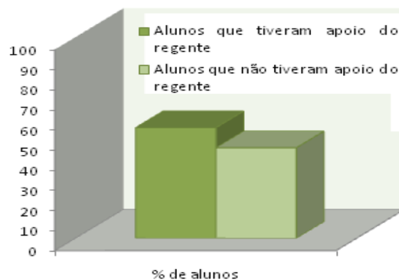
experiência em sala de aula.