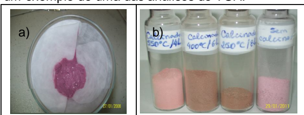
Figura 1. Foto das sílicas antes e depois das calcinações.

O material catalítico é sintetizado a partir da hidrólise do TEOS e da redução da espécie [AuCl 4 - ] em meio alcalino. Após 2h a 50 °C, o sólido vermelho é recuperado por filtração (Figura 1a) e seco em estufa. Em seguida o material foi calcinado em diferentes condições: 250°C/8horas; 400°C/6horas e 550°C/4horas com uma taxa de aquecimento de 5°C/min (Figura 1b). O material foi caracterizado por termogravimetria. A Figura 2 dá um exemplo de uma das análises de TGA.