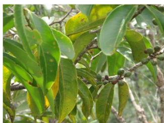
Figura 1: Foto de folhas de Maytenus gonoclada .

A espécie Maytenus gonoclada Martius (Figura 1), conhecida como “Tiuzinho”, ocorre principalmente nos estados da Bahia, Minas Gerais, Rio de Janeiro e São Paulo 2 . Os triterpenos: 3-oxofriedelano, 3 \beta -hidroxifriedelano, 3,11-dioxofriedelano, 3,16-dioxofriedelano, 3-oxo-12 \alpha -hidroxifriedelano, 3-oxo-29-hidroxifriedelano, 3 \beta -taraxerol, \alpha -amirina, \beta -amirina e lupeol, já foram isolados do extrato hexânico e em acetato de etila de folhas e galhos de M. gonoclada 3 .