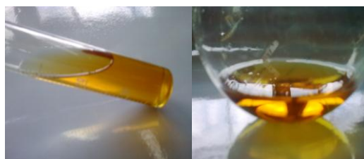
Figura 1. Produtos obtidas nas reações 1 e 2.