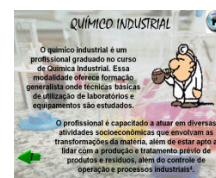
Figura 2 e 3: Diálogos que proporcionam acesso às telas específicas e tela específica sobre o químico industrial.