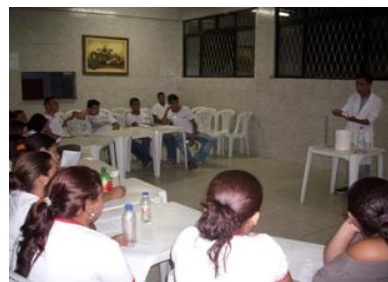
Figura 2. Registro da aula prática em uma das turmas trabalhadas.

A Figura 2 representa, qualitativamente, o interesse e a atenção do alunado, no momento da experiência.