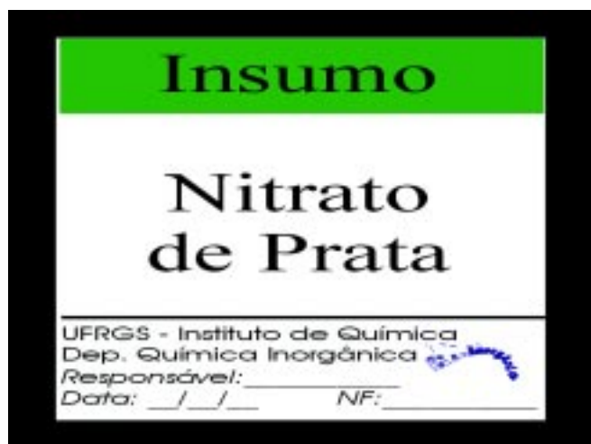
Figura 2. Exemplo de Rótulo de Insumo.

As Figuras 2, 3 e 4 mostram alguns exemplos destes rótulos que utilizam a convenção anteriormente descrita.