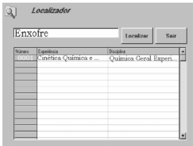
Figura 10. Página do Localizador.

informação é facilmente atualizada e disponibilizada para o usuário que busque um conhecimento mais detalhado sobre um determinado resíduo.