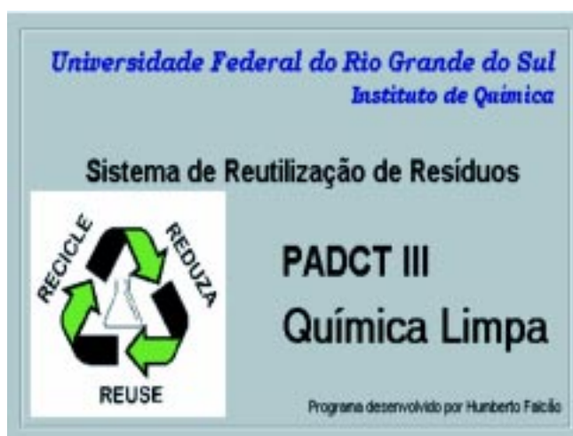
Figura 5. Programa de Cadastramento: “Sistema de Reutilização de Resíduos”.

As Figuras 5, 6, 7, 8, e 9 mostram um exemplo de ficha devidamente preenchida e a Figura 10 mostra o localizador de informações.