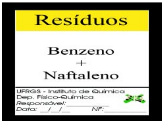
Figura 3. Exemplo de Rótulo de Resíduo.