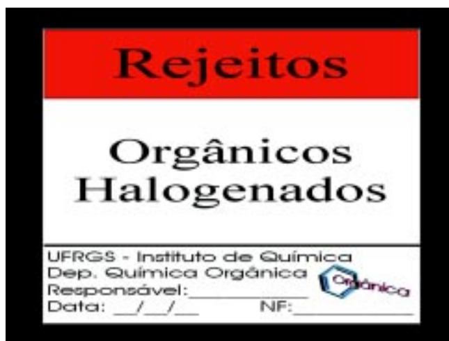
Figura 4. Exemplo de Rótulo de Rejeito.